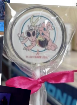
Soixante-quinze participants au stage multisports